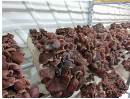
きくらげ栽培の様子

これから春に向かって気温が上昇すると、きくらげの栽培環境も良くなって成長も早くなり収穫量も増えて品質も安定していきます。日頃からきくらげの成長の様子をチェックしたりと栽培管理をしっかり行っています。