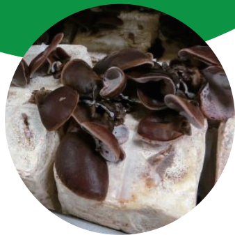
きくらげ栽培の様子

梅雨が明けた8月は、記録的な猛暑日が続きました。7月の日照不足と猛暑により露地栽培の野菜類などは不作のものが多い状況でしたが、ハウスの水耕栽培レタスやコンテナ栽培きくらげは、その影響も少なく、安定した栽培ができました。